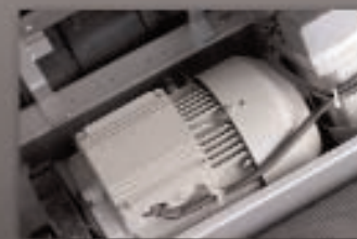
MOTOR SIEMENS 4 c.v. potencia